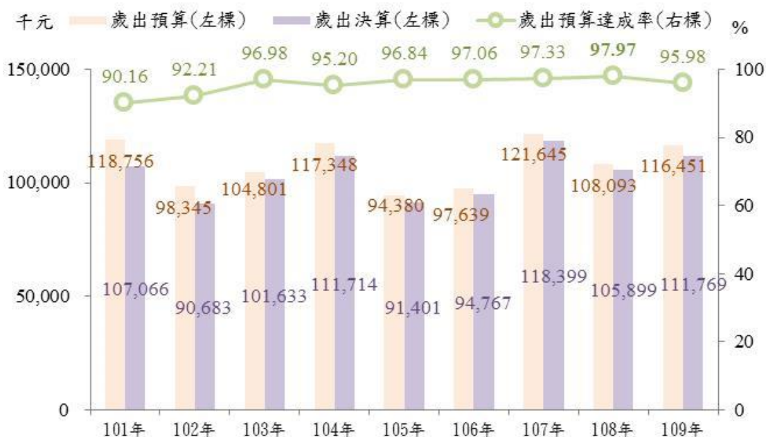
圖 2 101~109 年高雄市燕巢區公所歲出預決算概況