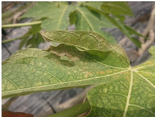
葉蟎密度高時會結網以利風吹散播