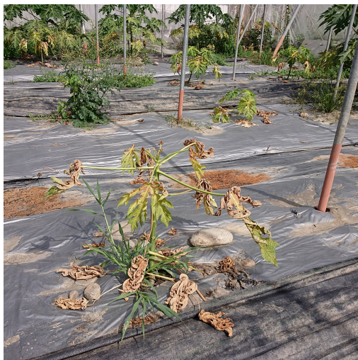
葉蟎密度高影響植株生長勢