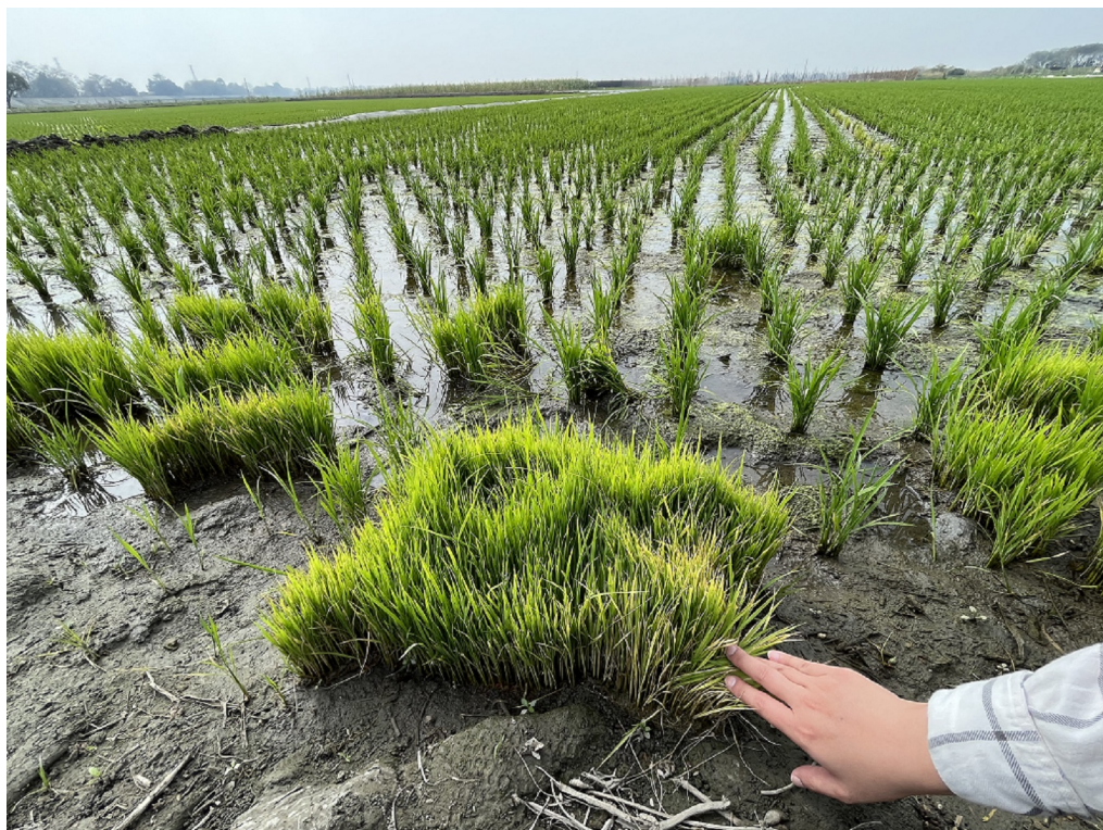
檢視田邊秧蘗發病情形，若已出現病斑可即時進行預防