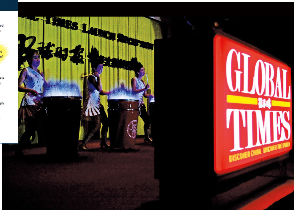
美國政府認為自習近平擔任總書記以來，中國共產黨直接控制在美的中共媒體為大陸進行宣傳。

2020年6月美國國務院發表新聞稿宣布，除先前的「新華社」外，另將「人民日報」、「中央電視台」等共9家大陸派駐媒體，列為「外國使團」。 (Source: U.S. DEPARTMENT of STATE, state.gov/designation-of-additional-chinese-media-entities-as-foreign-missions)