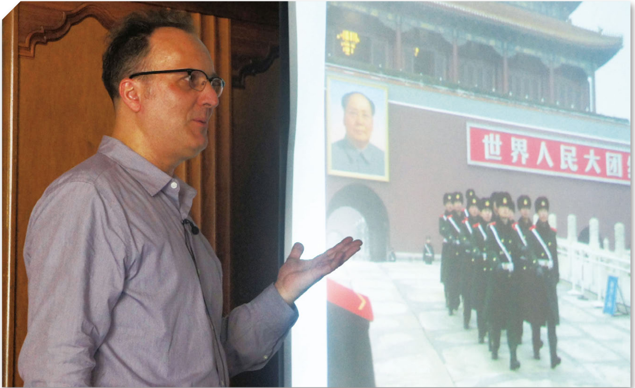
孔子學院在教學時都必需使用中共教育部所核可的教材，且教員大多受到共產主義影響。

(Tiananmen)、圖博(Tubo，即西藏)；此外孔子學院的教員，大多是由大陸本地招聘及培訓的，常期被灌輸共產主義意識形態。