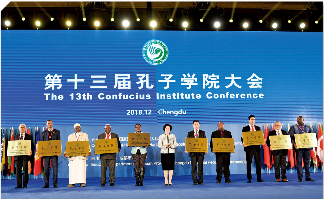
若大陸官方減少對於孔子學院的控制，讓其成為純粹以文化推廣的教育機構，想必能讓各國稍微安心，接納中華文化。

截至 9 月為止，已有丹佛、奧克拉荷馬、北卡羅來納、愛默立等 4 所大學宣布配合政府政策，關閉孔子學院。