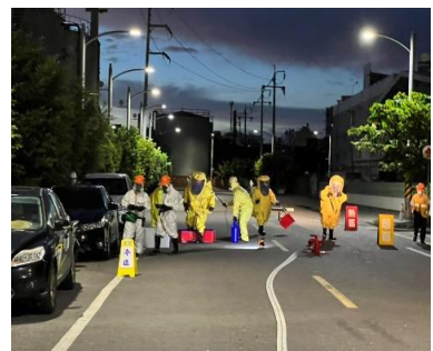
狀況解除進行除污作業