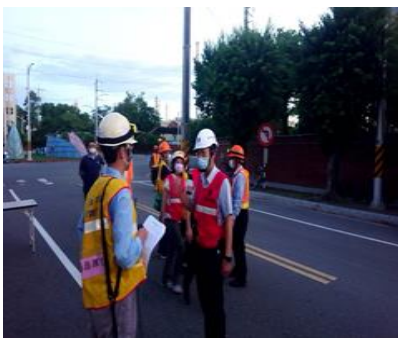
服務中心及工業區聯防組織報到