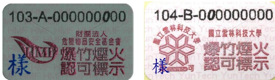
一般爆竹煙火認可標示

(三) 施放場所規定:下列地點不得施放爆竹煙火，違反者得處新臺幣 6 萬~30 萬元罰鍰。