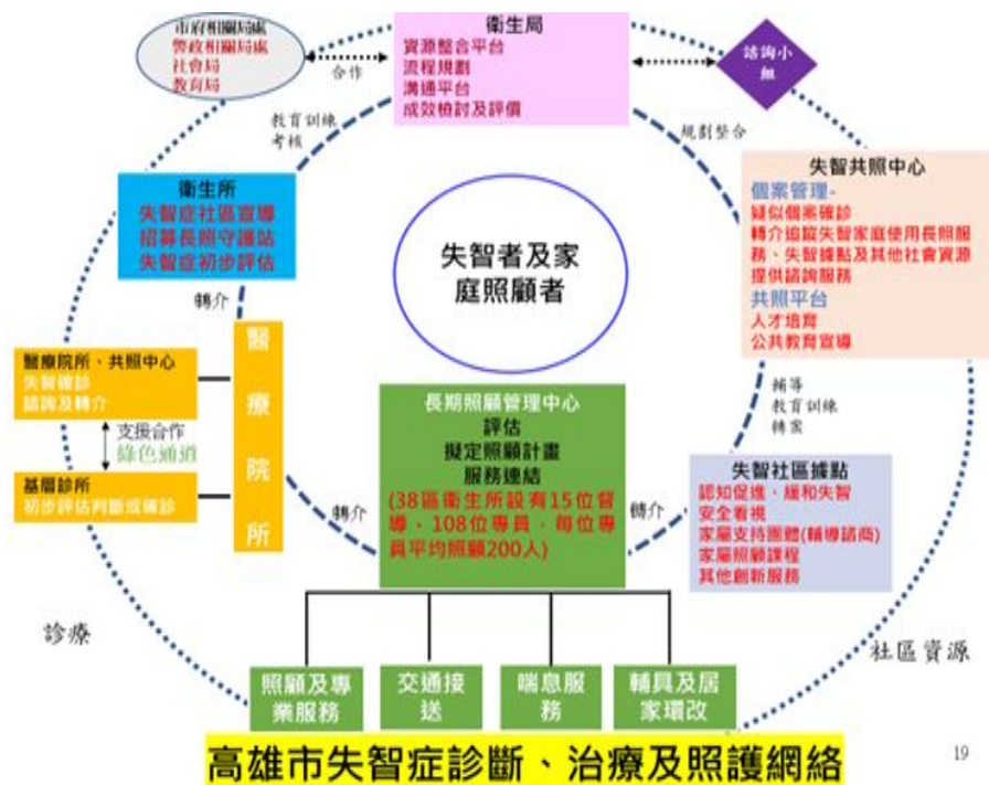
圖 1、高雄市失智照護網絡示意圖