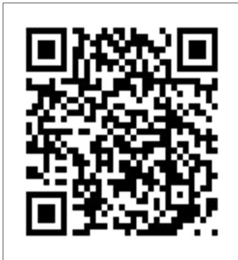
「環境教育友你有我」臉書社團