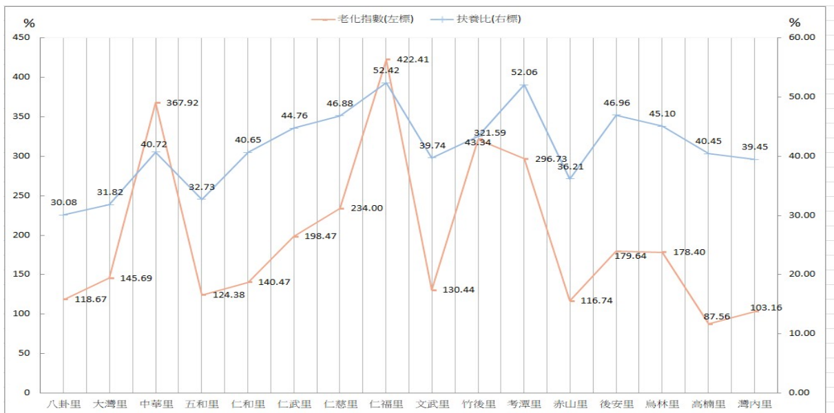
圖 2 114 年底仁武區各里老化指數及扶養比

再以扶養比作為個人扶養負擔分析，扶養比超逾百分之 40 有 10 個里，依序為仁福里 52.42、考潭里 52.06、後安里 46.96、仁慈里 46.88、烏林里 45.10、仁武里 44.76、竹後里 43.34、中華里 40.72、仁和里 40.65、高楠里 40.45，相較於去年，各里扶養比均較去年提高；且皆高於百分之 30。綜上所述，顯示出個人扶養負擔日漸增加的趨勢。（詳圖 2）