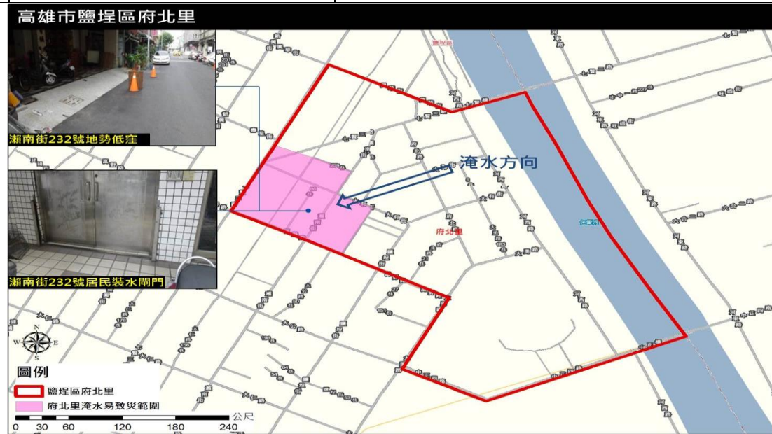
圖 1-2、府北里易致災淹水圖