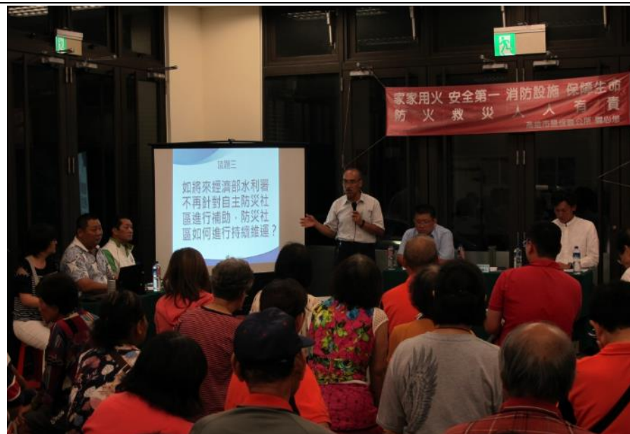
顏區長公民參與議題建議總結共識