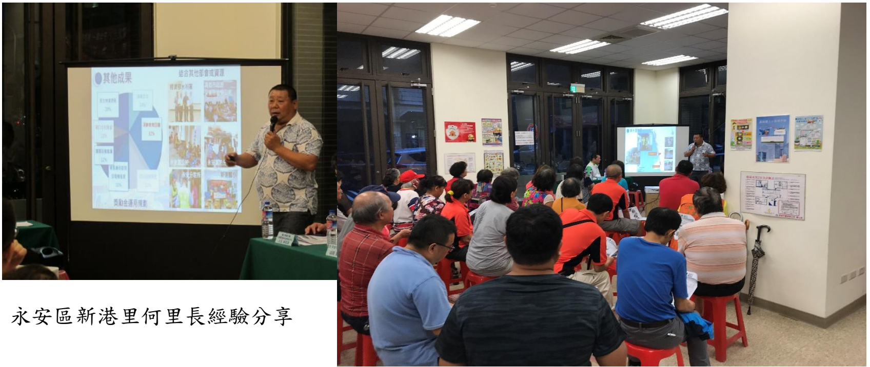
永安區新港里何里長經驗分享