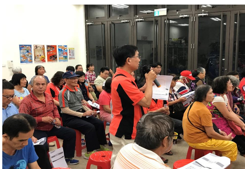
議題一公民參與民眾發言