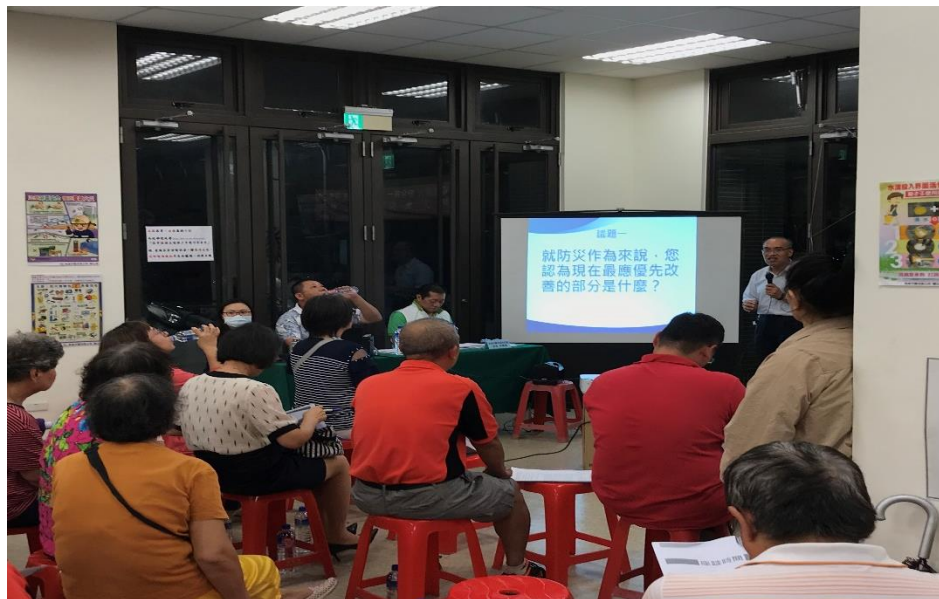
公民參與議題一討論說明