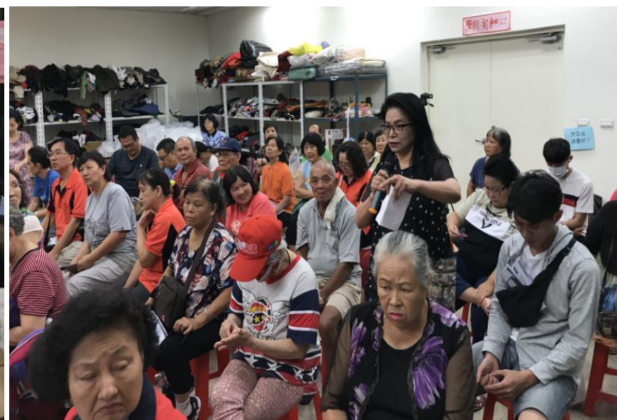
議題二公民參與民眾發言