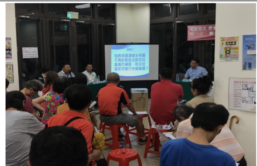
永安區新港里何里長公民參與議題三發表建議