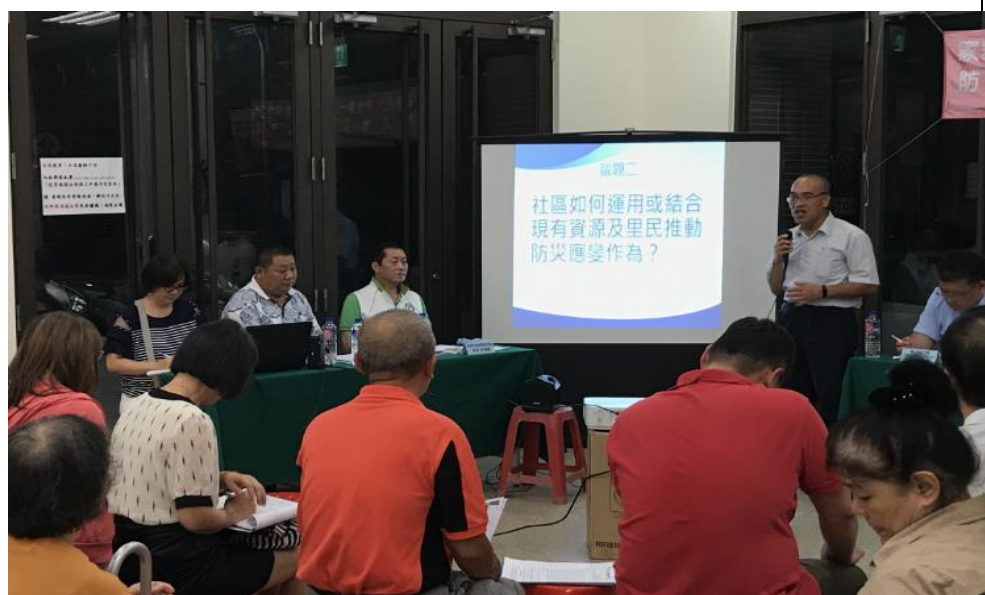
公民參與議題二討論說明