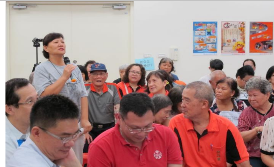
公民參與民眾發言