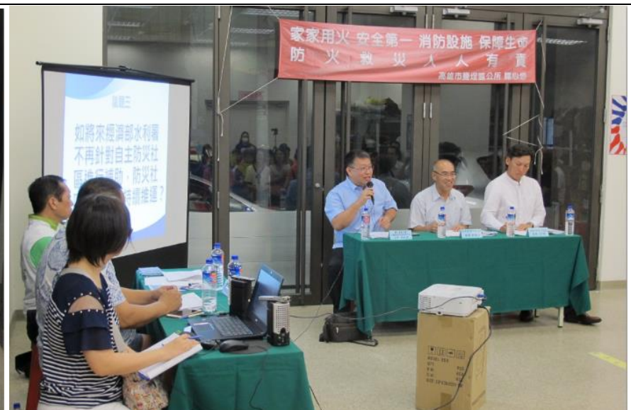
高雄大學吳教授議題公民參與建議發言