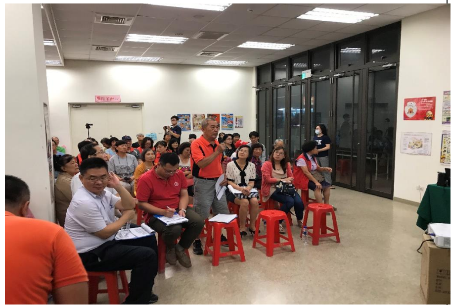
議題三公民參與民眾發言