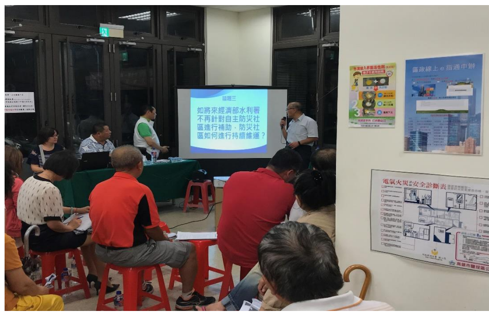
公民參與議題三討論說明