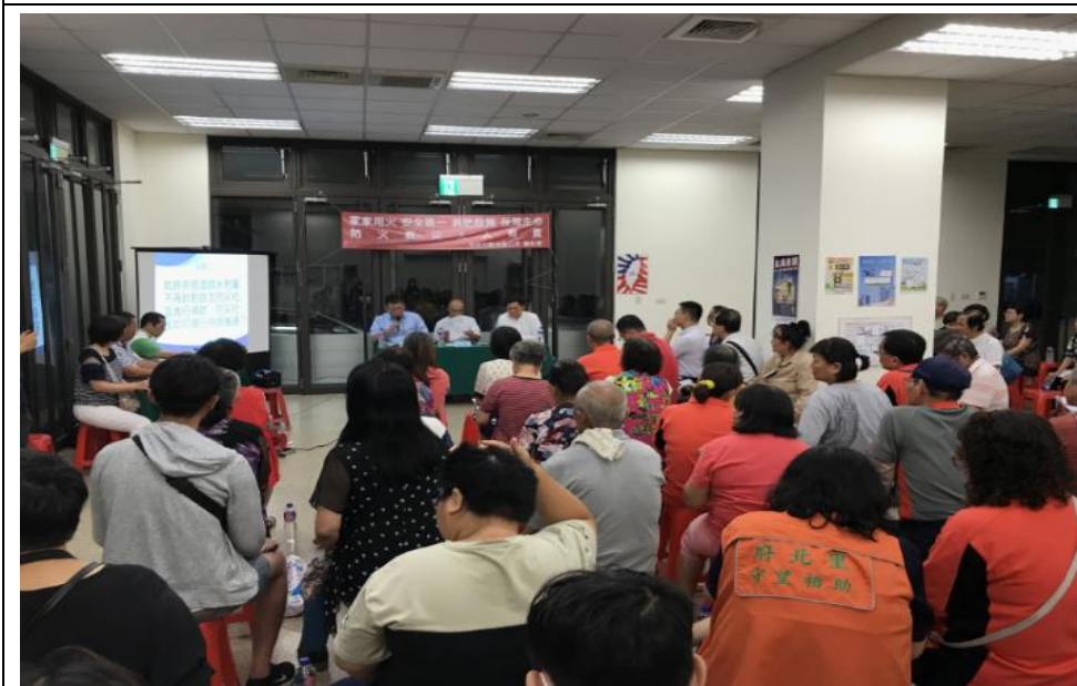
高雄大學吳教授議題公民參與建議發言