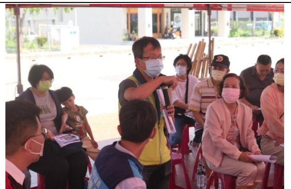
職能治療師公會提供建議