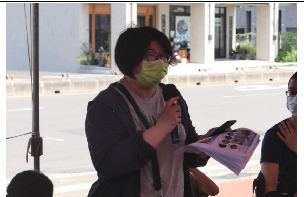
與會民眾提出意見