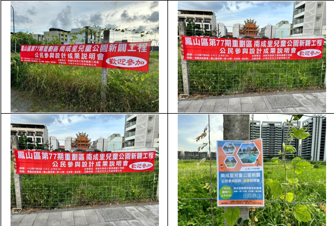
預定開闢公園現址/周邊懸掛布條及張貼海報宣傳