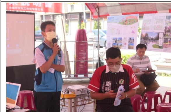
議員服務處提出意見