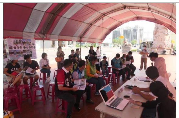
副總工程司主持會議