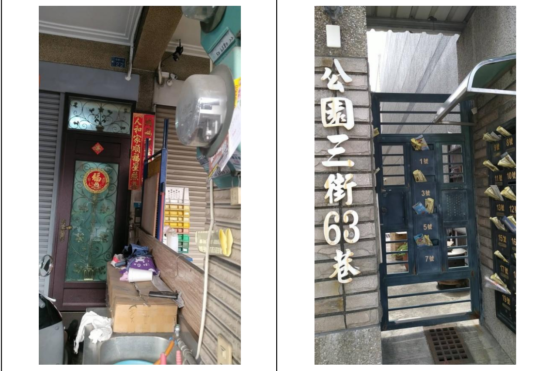
周邊住戶以信箱投地方式發送活動傳單