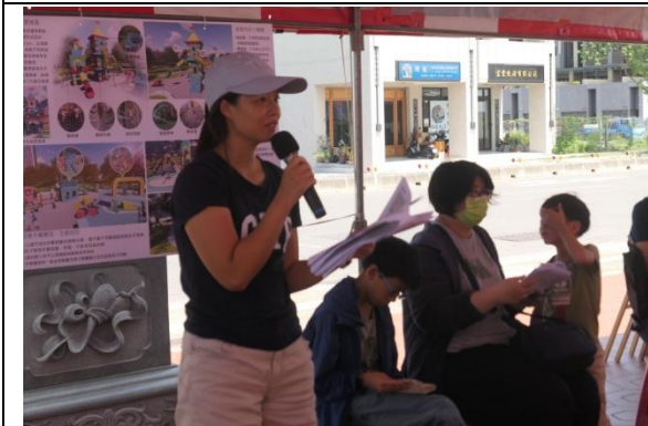
與會民眾提出意見