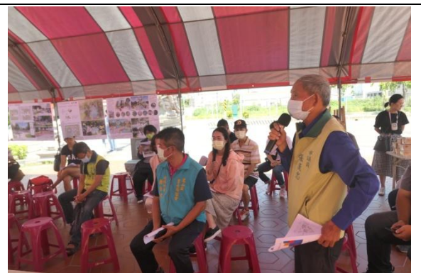
議員服務處提出意見