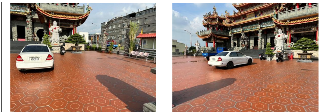
飛鳳宮前戶外廣場

因本案公園皆為新闢公園，公園預定場地尚未開發無法於現地辦理，因此經評估洽詢後選定於鄰近公園預定地之飛鳳宮前戶外廣場辦理，並於活動前進行場地之現場勘查。