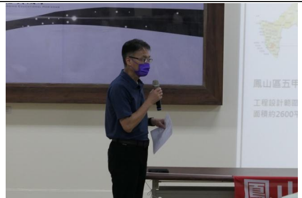
陳副總工主持會議