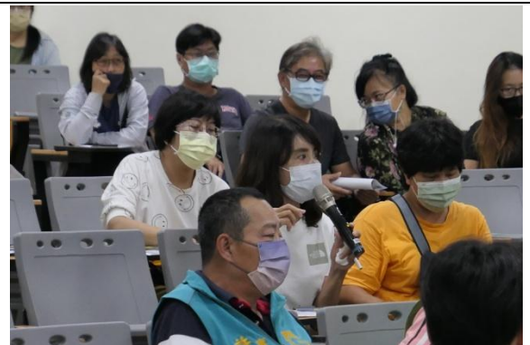
愛狗人協會代表提供建議