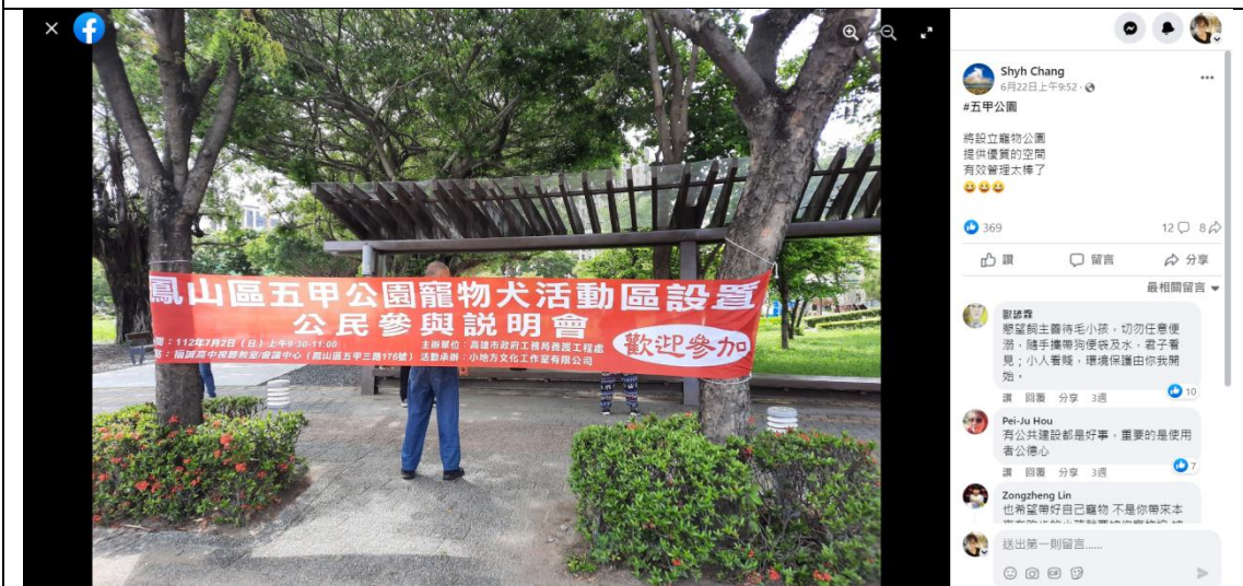
五甲地方社團 FB 粉絲專頁宣傳