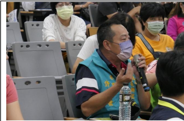
福誠里長發表意見