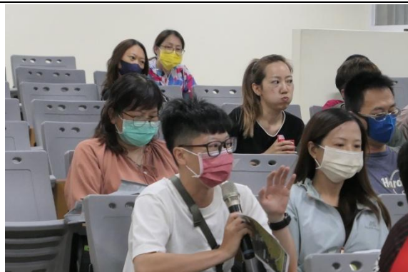
與會民眾發表意見