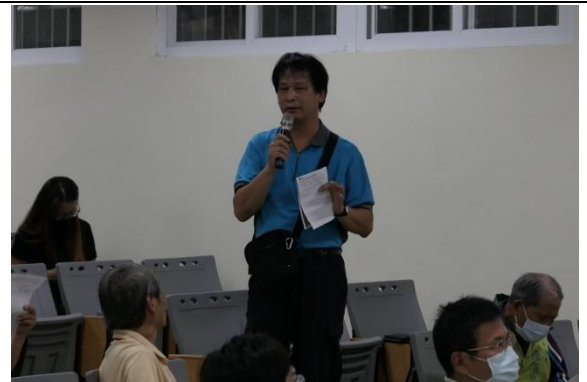
與會民眾發表意見