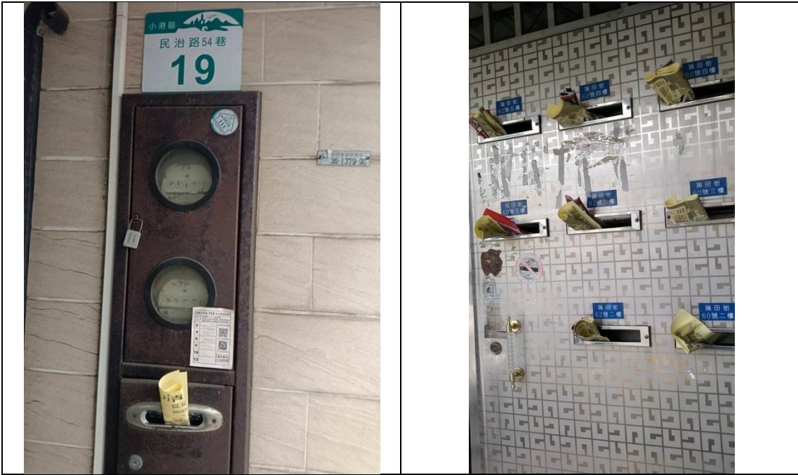
公園周邊住宅以傳單投遞信箱方式通知