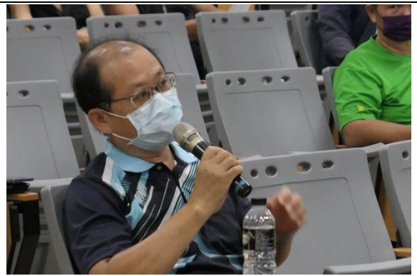
與會民眾發表意見