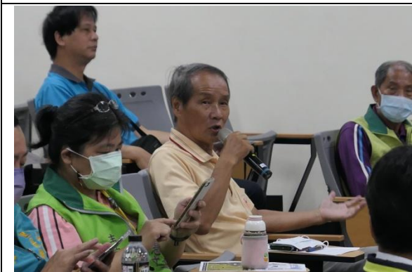
動物福利協會提供建議