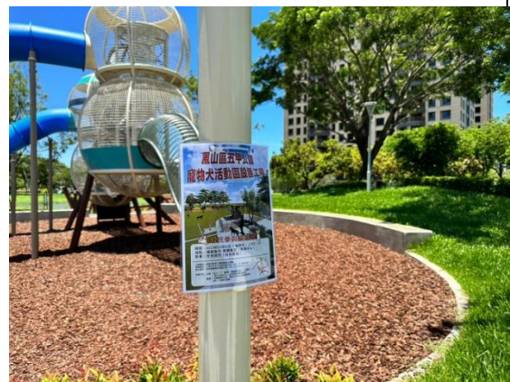
公園內部、入口及周邊道路旁懸掛紅布條宣傳