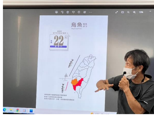
說明：介紹烏魚的季節及來源地。