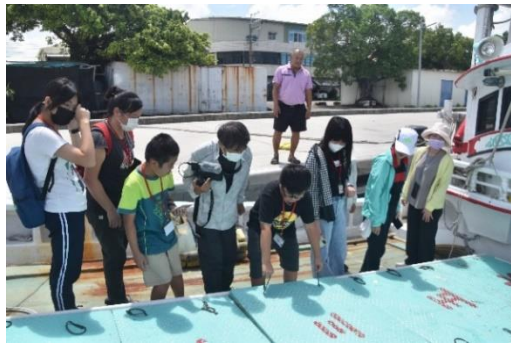
說明：體驗捕魚的操作流程。