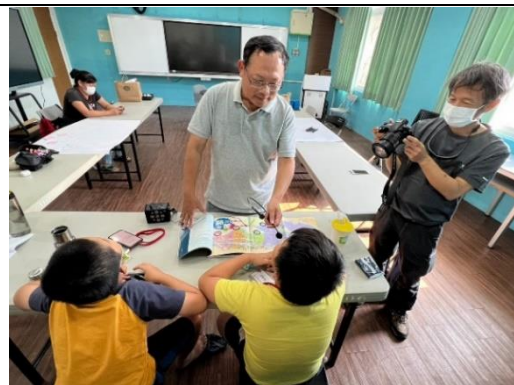
說明：透過社區雜誌認識當地聚落。