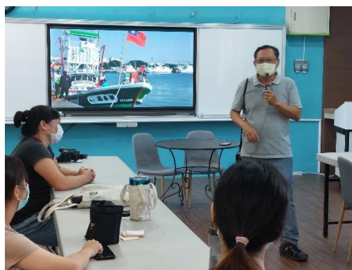
說明：提問大家對茄萣的漁村意象