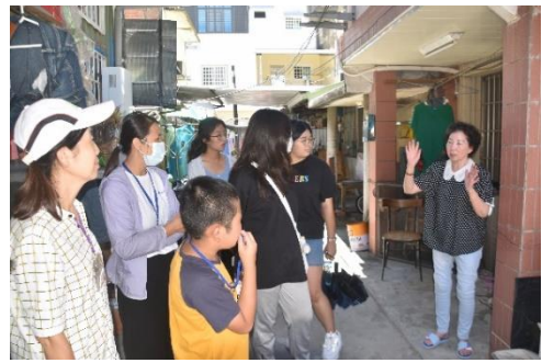
說明：分享大陳義胞海外打工的盛況。