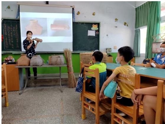
說明：介紹漁村文物館收藏的竹編品。