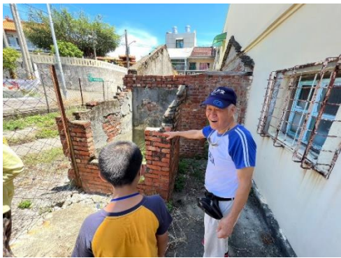
說明：從遺址觀察以前生活條件困苦。