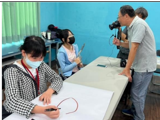
說明：演練採訪中的技巧。