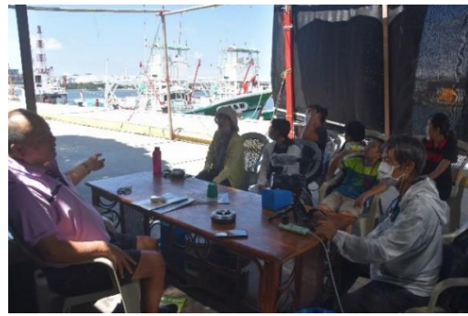
說明：訪問當地船隊的船長老闆。