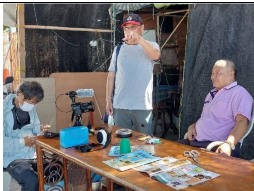
說明：講烏魚產業與氣候數據的關聯。