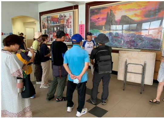
說明：分享社區田調的大陳義胞居民造冊成果。