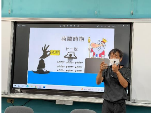
說明：漁業在地方上的發展與政策息息相關。