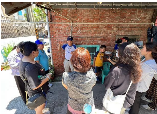
說明：觀察茄萣的人口外流現象與背後代表的經濟壓力。