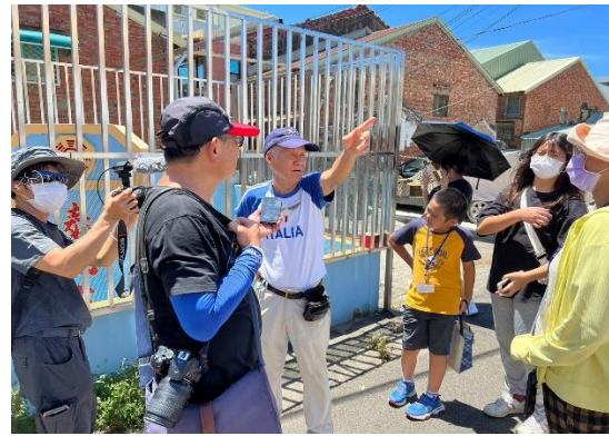
說明：陳述不同族群在當地融合共處的陳年往事