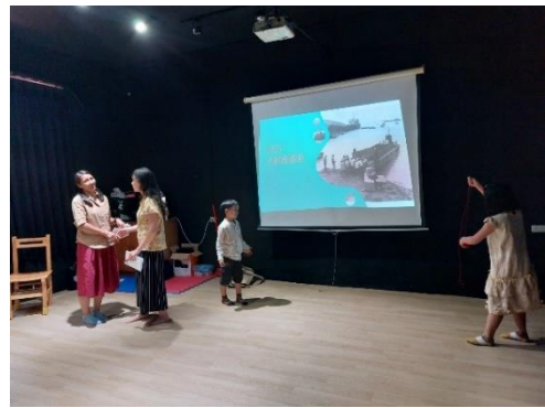
說明：演出大陳義胞撤退來台的情勢。