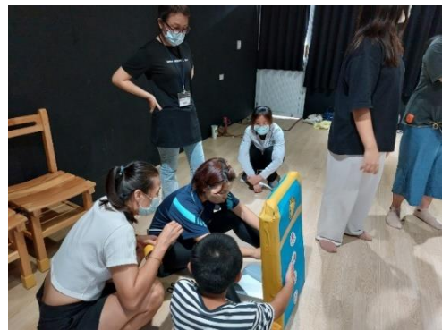
說明：合力製作演出道具中。