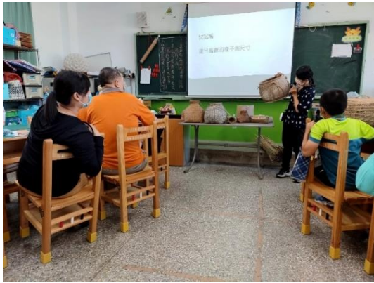
說明：介紹漁村文物館收藏的竹編品。