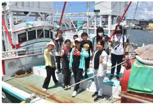
說明：親自踏查專門捕烏魚子的漁船。