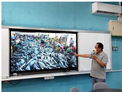
說明：說明茄萣產業的過去與未來