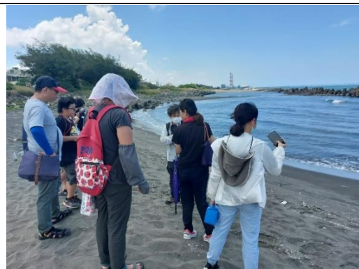
說明：茄萣海岸公園了解海岸線後退。