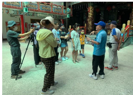
說明：當地居民與廟宇之間的情感連結強烈，廟宇的慶典盛事總能號召凝聚在地居民們。