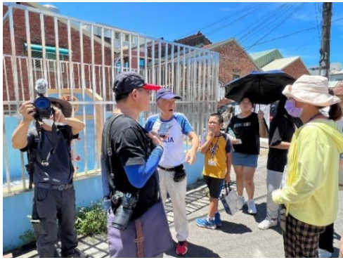
說明：認識長輩童年步行上學的途徑。