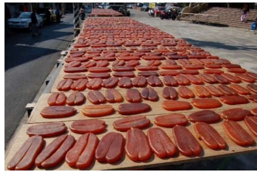
說明：社區中常見的曬烏魚子日常。