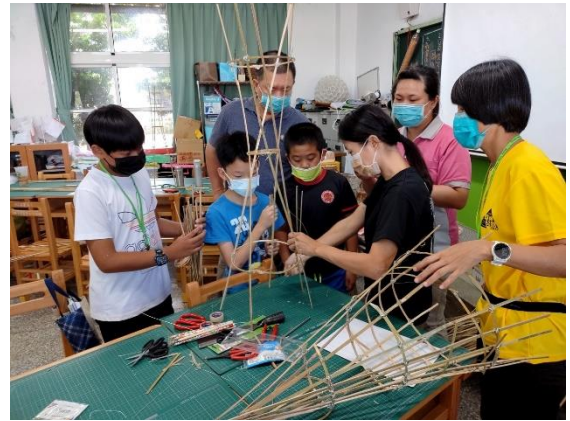
說明：介紹漁筌架構。