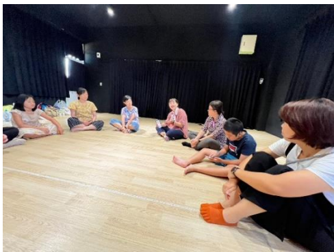
說明：參與社區劇場人員分享心得。