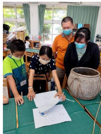
說明：老師以設計圖講解漁具的構造。