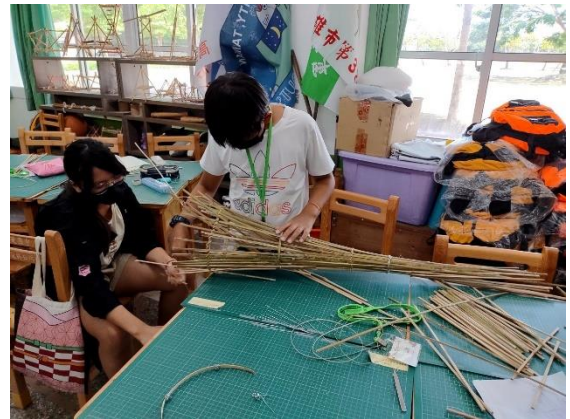
說明：動腦思考需要的竹片數量。