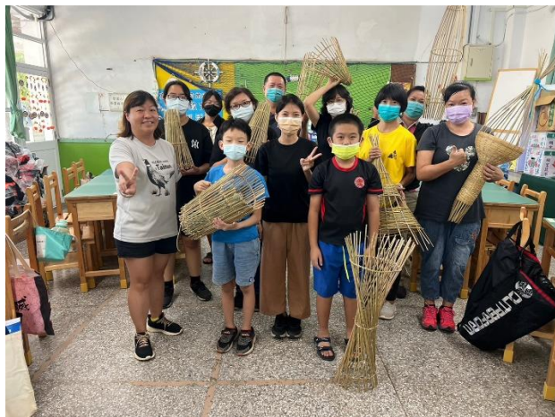
說明：會後與成果作品大合照。