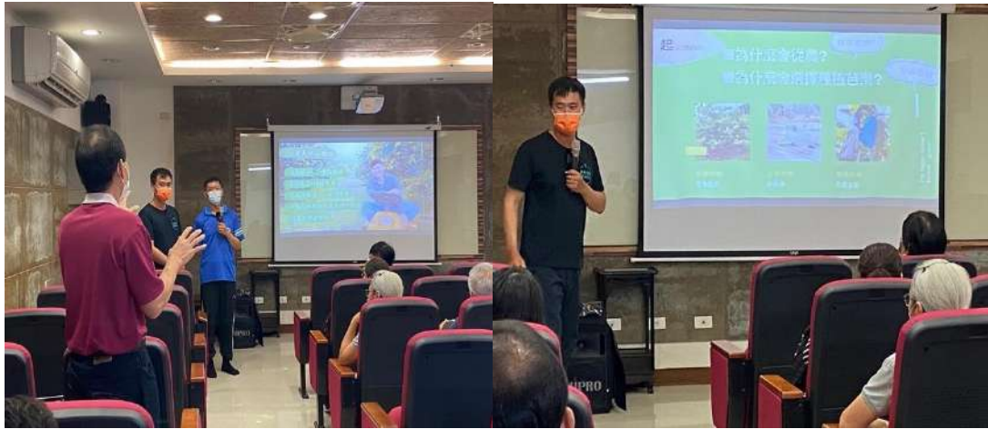
與會聽眾給予回饋與提問