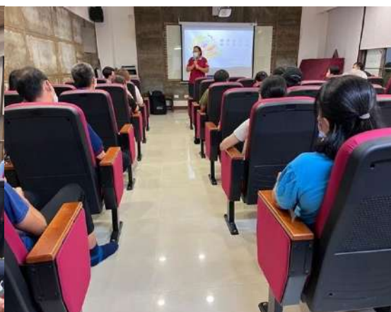
回應聽眾公民論壇的辦理原意