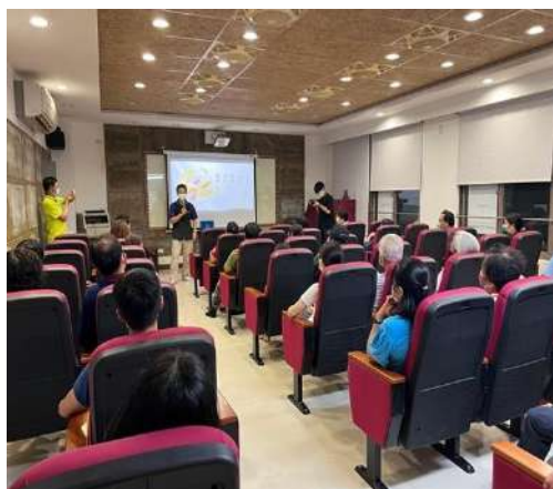
與會回饋講者內容