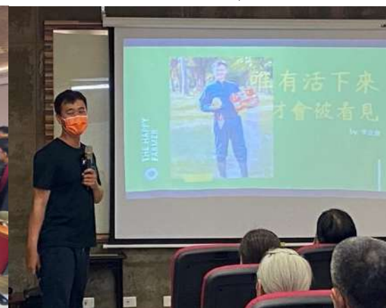
提醒青年返鄉或創業的名言