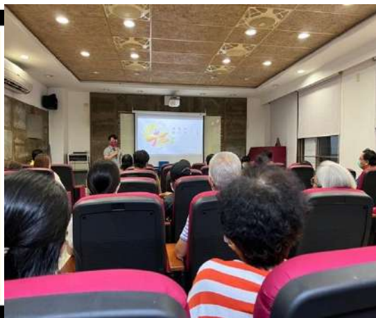
議題分享、參與狀況