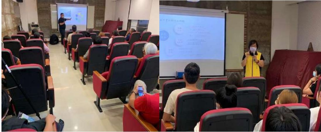
講者分享與區長回應