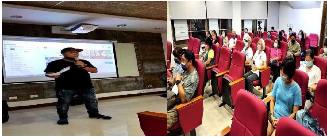
講者以 B-BOX 音樂出場