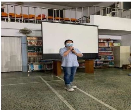
執行單位分享組織陪伴歷程