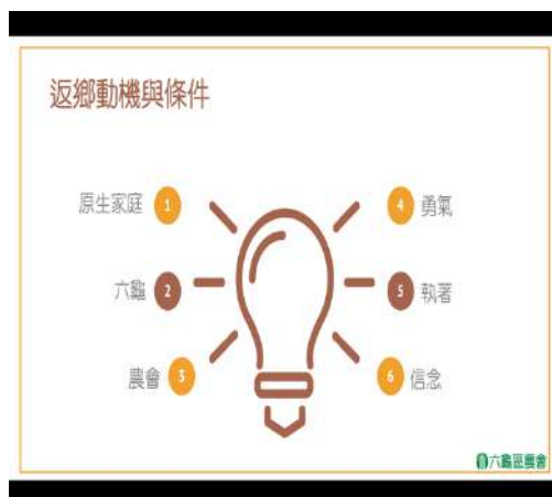
講者對於自己返鄉就業的表述