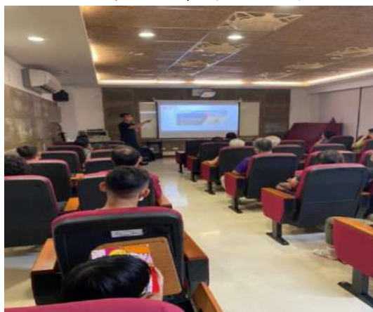
分享現今創業經營方式。