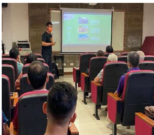
主講人分享課程主題