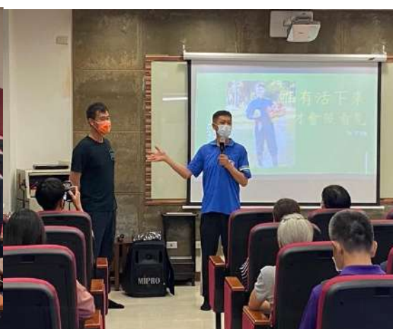
引言人介紹主講人經歷