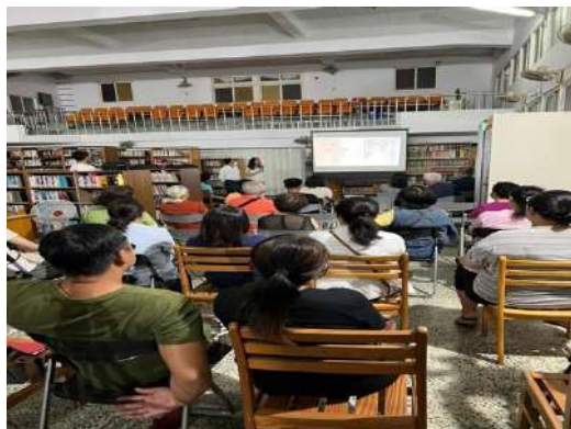
創業的另一半角色