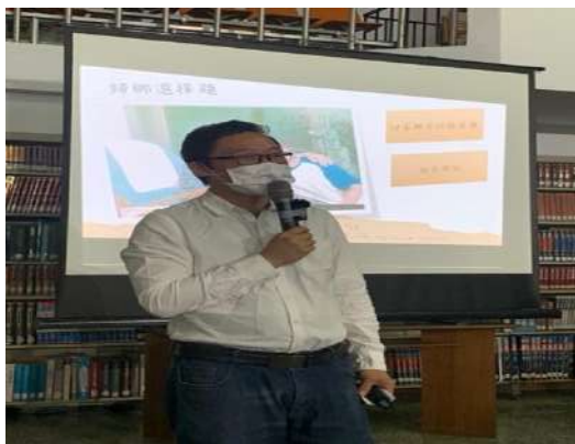
區公所蘇主任蒞臨。