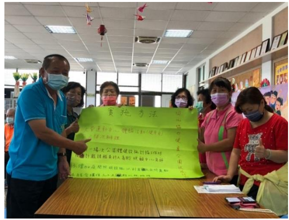
說明：最終行動方案(8/13)