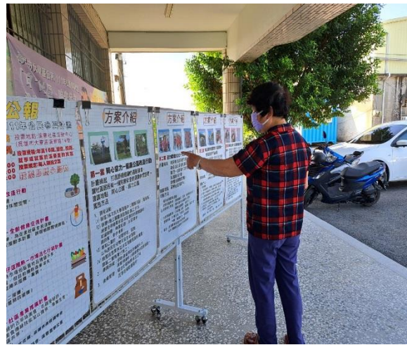
說明：選舉公告、方案介紹