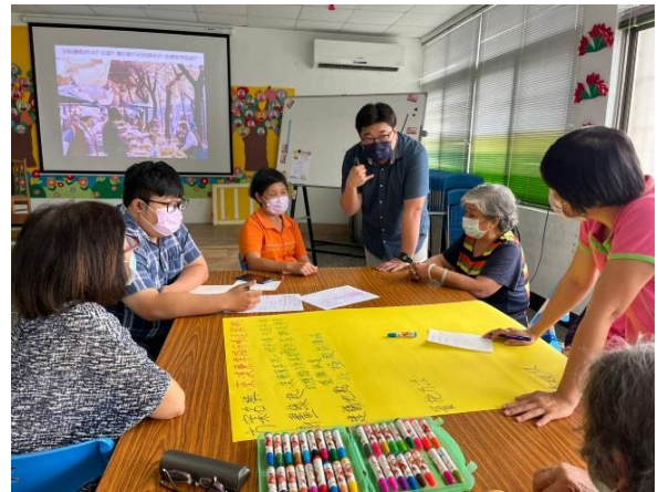
說明：住民大會2-討論行動方案(7/30)