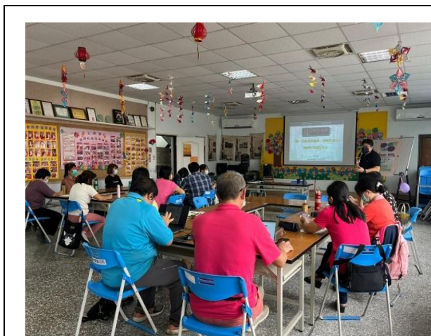
說明：培訓審議種子教師(6/18)