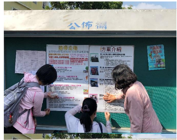
說明：選舉公告、方案介紹文宣張貼