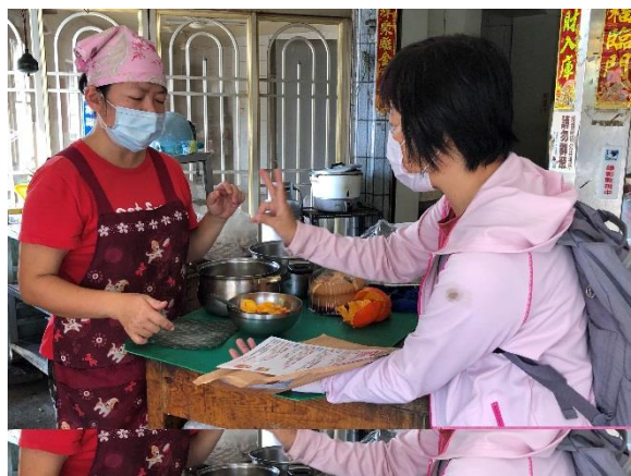
說明：選舉公告、方案介紹文宣發放