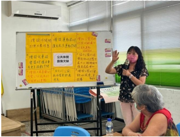
說明：住民大會1-策略構想(7/23)