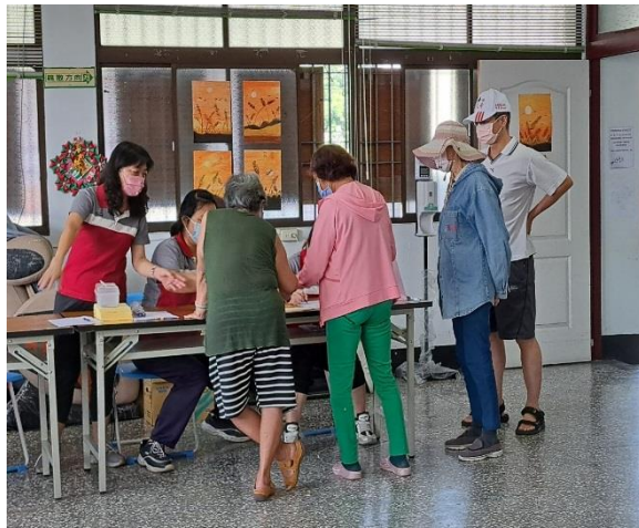
說明：民眾領取選票