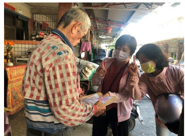
說明：選舉公告、方案介紹文宣發放