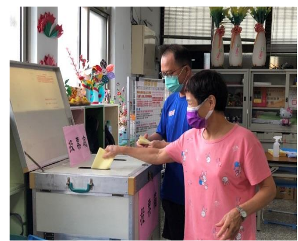
說明：民眾參與投票