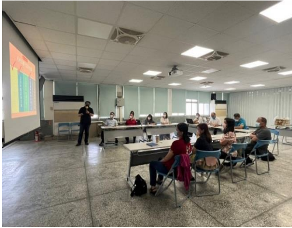
說明：行動方案評估會議(8/3)