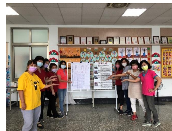
說明：票選結果第一、二案獲最高票