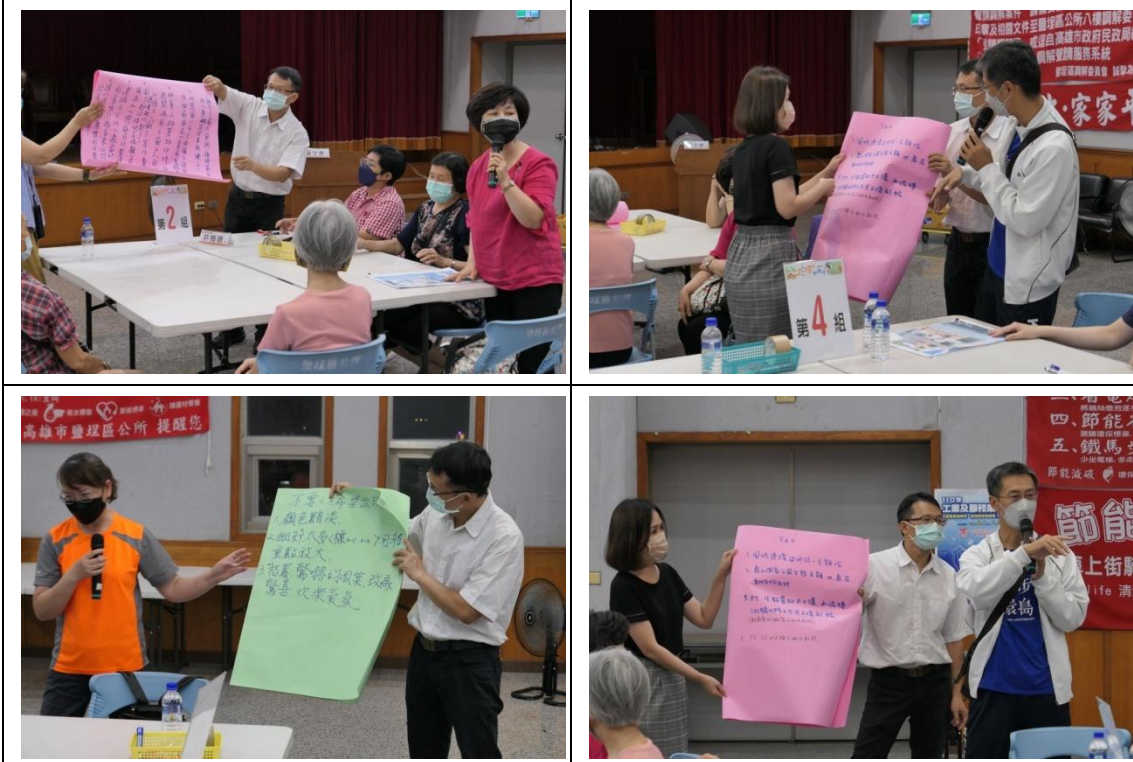
分組討論成果發表