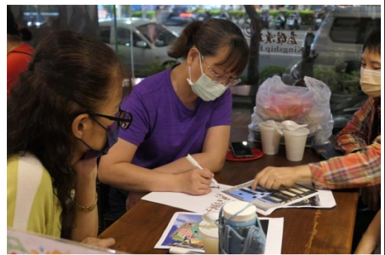
分組討論狀況熱烈、認真記下意見