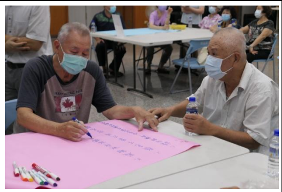
第一次看到設計圖，民眾寫下初步意見