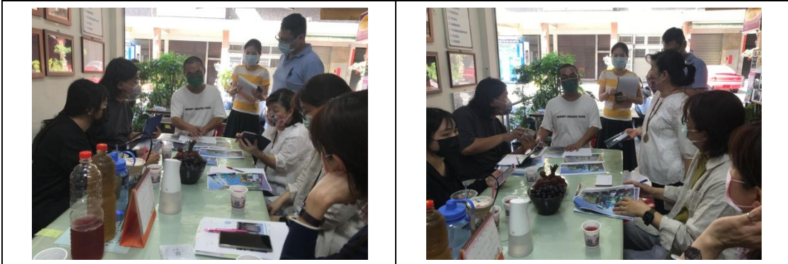
彩繪牆相關關係人針對各圖面進行討論，確認圖案設計風格