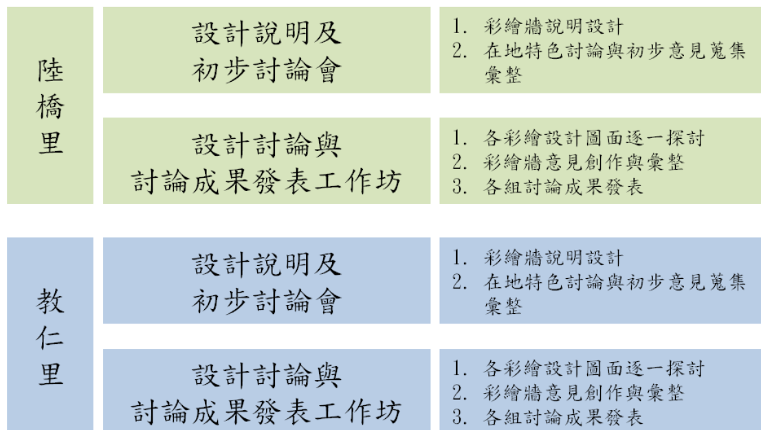
圖1 本計畫執行架構

本計畫於鹽埕區輕軌站周邊之陸橋里及教仁里，針對大型牆面彩繪議題推動民眾參與，廣泛蒐集民眾意見，以利彩繪牆後續修正與推動。本團隊針對計畫執行，規劃每里二場次討論會或工作坊，透過不斷的檢視及腦力激盪，讓工作坊成為民眾間以及民眾及公部門間的溝通平台，以深化民主素養與公民意識。本計畫執行架構如下圖1所示。