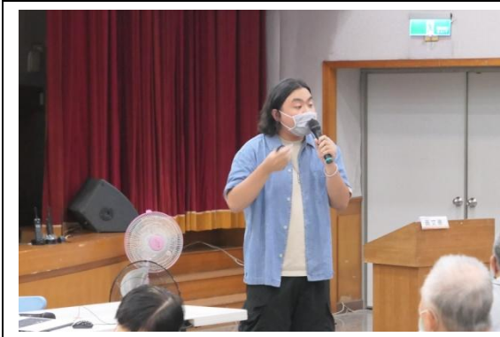
廠商針對問題回應