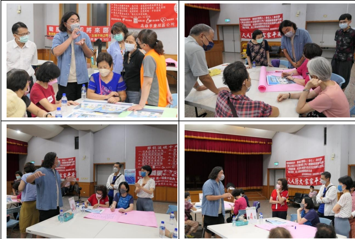
廠商與民眾面對面討論說明