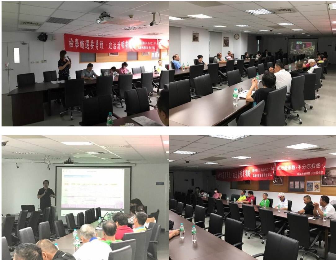
圖 2.第一次徵詢會議(8/3)

第一次徵詢會議於八月三日召開，邀請旗津漁村文化事業計畫相關人士出席與會，討論事業計畫及支持性公共建設內容並提出修正建議，同時盤點漁業署各項補助計畫及其可行性，討論事業內容研擬部會計畫爭取經費。