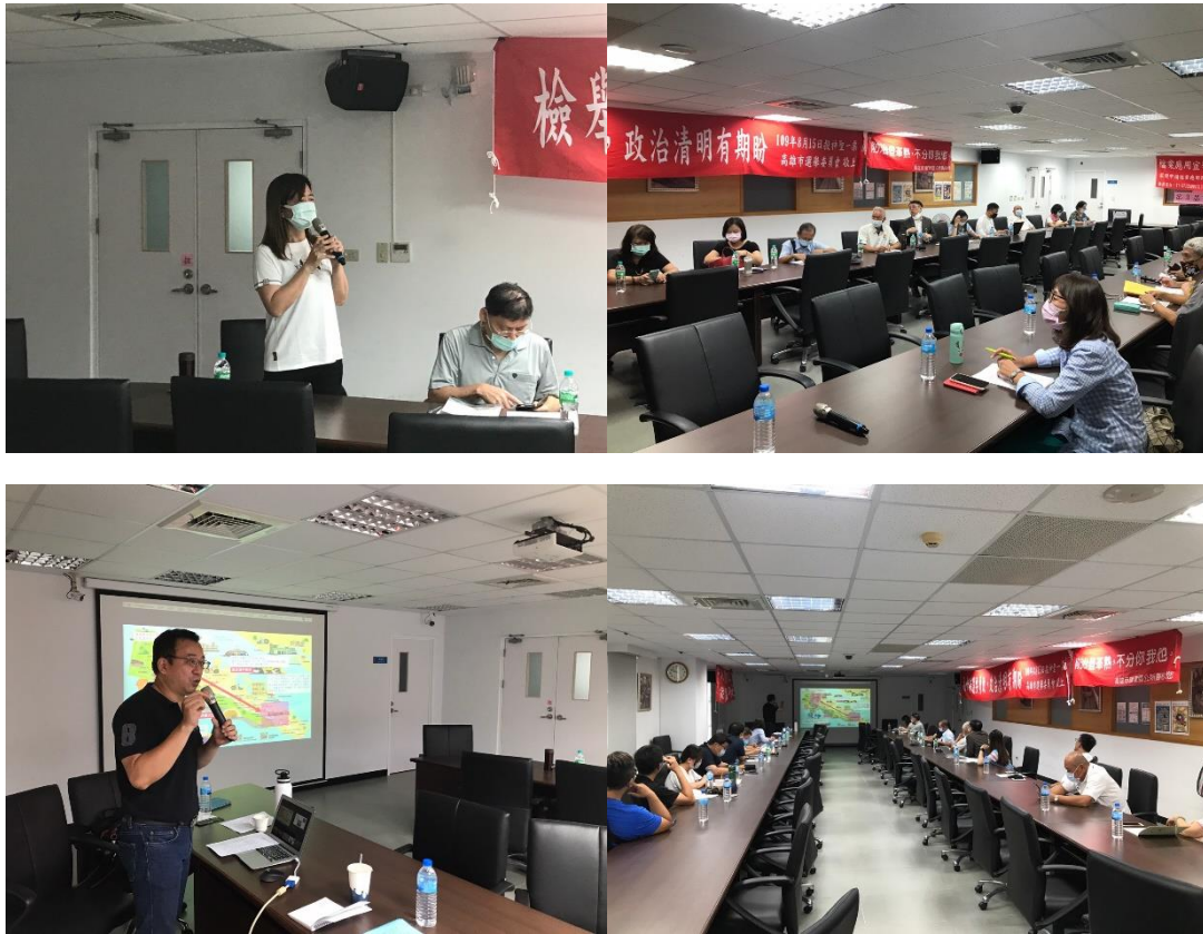
圖 3.第二次徵詢會議(8/10)