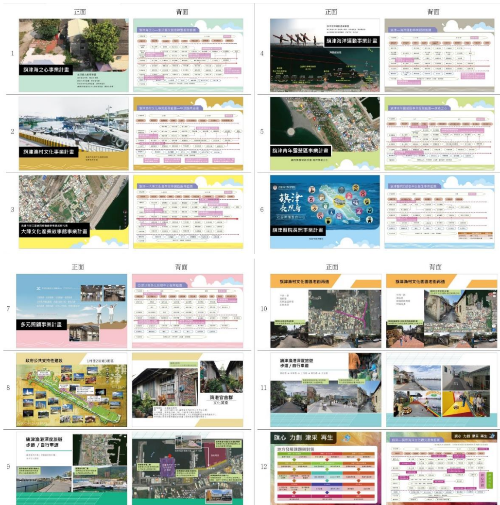
圖 11.事業計畫及支持性公共建設之雙面手拿板設計稿

依合約辦理徵詢會議兩場、旗津地方創生事業計畫一式、部會計畫前置作業兩式、成果發表會一場，並製作成果報告一式。