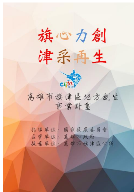
圖 4.高雄市旗津區地方創生事業計畫書

蒐集旗津地方資料，整合有意願提出計畫之事業體，協助提出事業計畫，撰寫地方創生事業計畫書，並持續滾動修正。