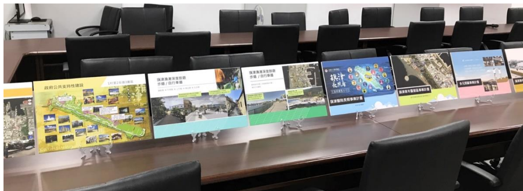
圖 13.雙面手拿板實照