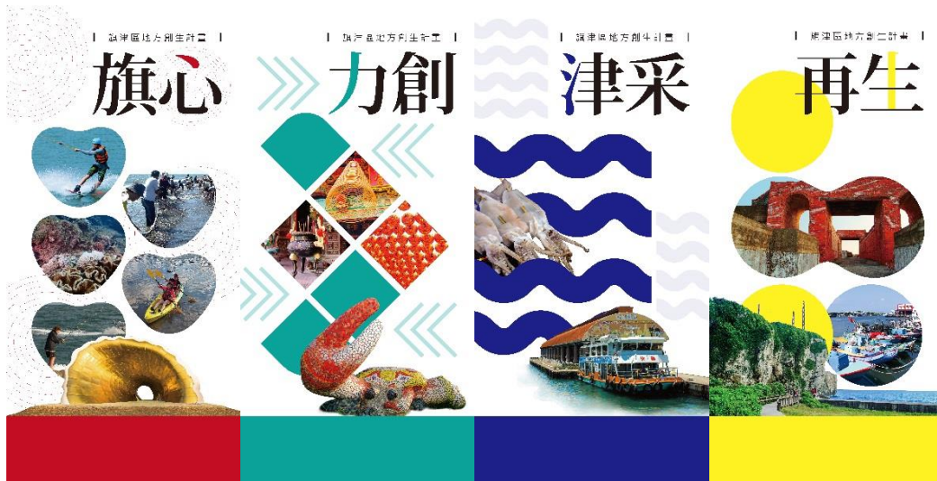
圖 12.旗津區地方創生計畫易拉展設計稿