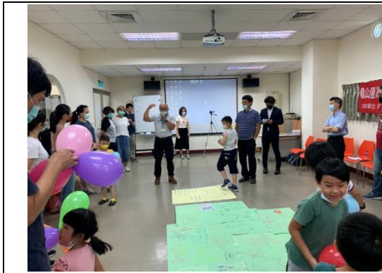
林副總工程司針對討論進行總結