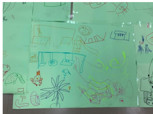
小朋友對遊戲場的想像