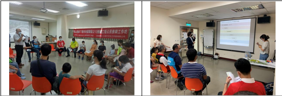
針對規劃設計進度進行說明