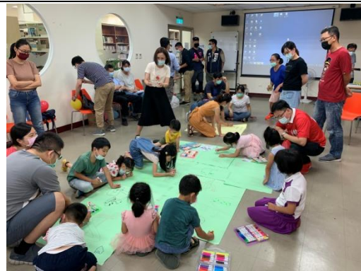
家長也一同討論公園遊戲場的想法