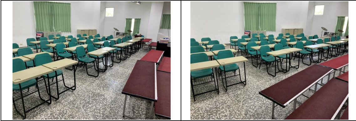
鳳翔國中場地現場勘查