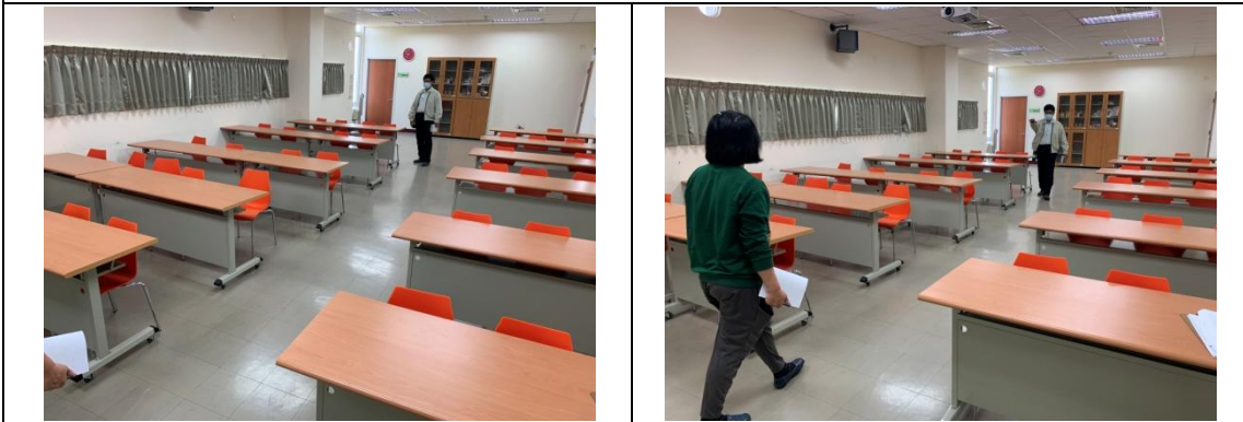
中崙圖書館現場勘查