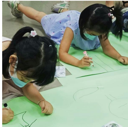
小朋友以畫圖方式呈現理想中的公園遊戲場