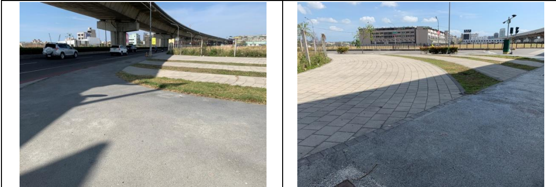
公12旁人行廣場現場勘查