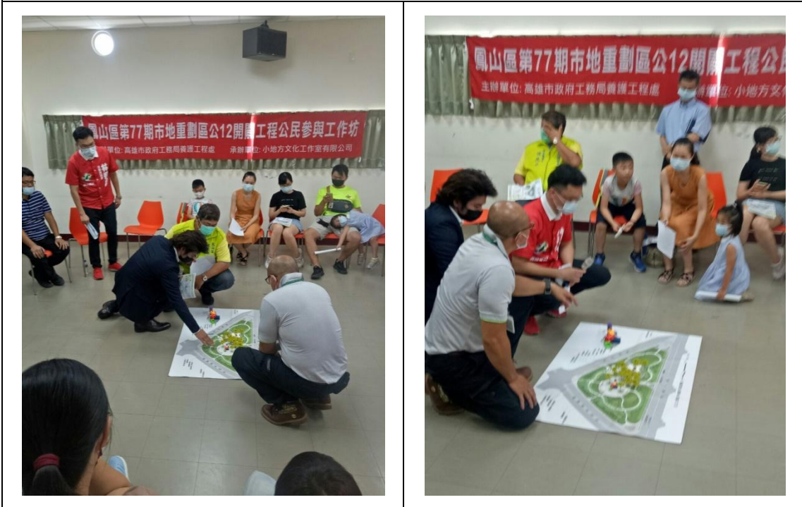
大人小孩一起以模型輔助討論進行