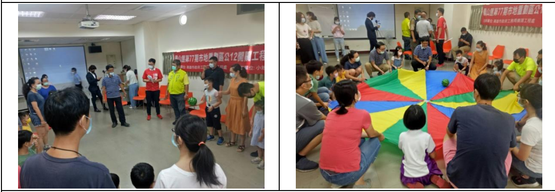
以遊戲拉近彼此距離