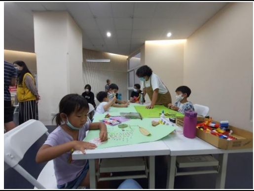
兒童由幼教老師帶領，以繪圖及積木等方式進行創作