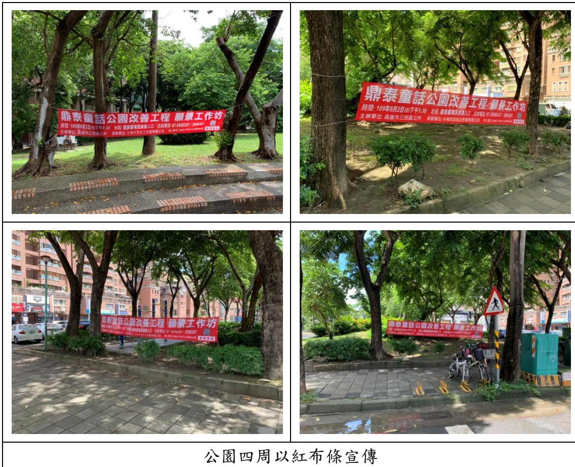
公園四周以紅布條宣傳