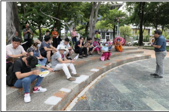
講師說明活動進行方式