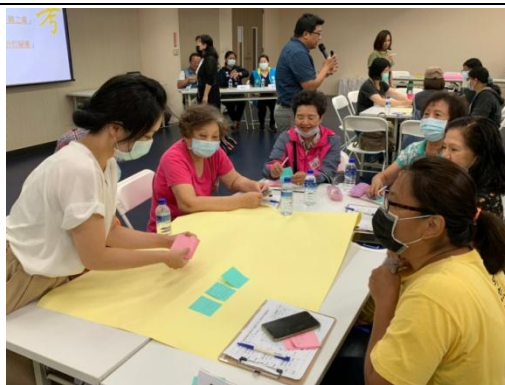
桌長協助將大家的意見討論後加以分類