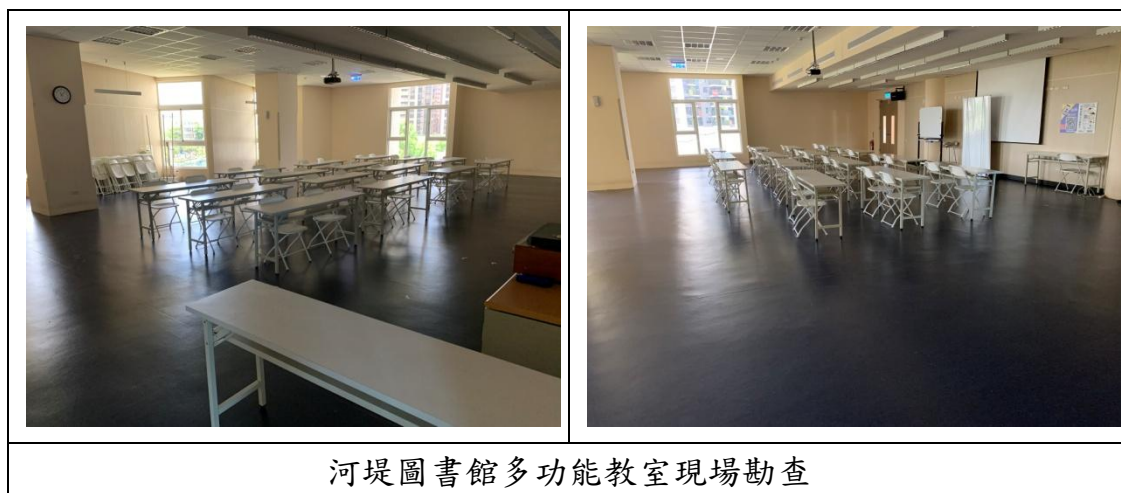
河堤圖書館多功能教室現場勘查