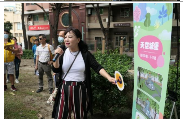
逐一檢視各項設施預定空間，並由區長親自回應民眾問題