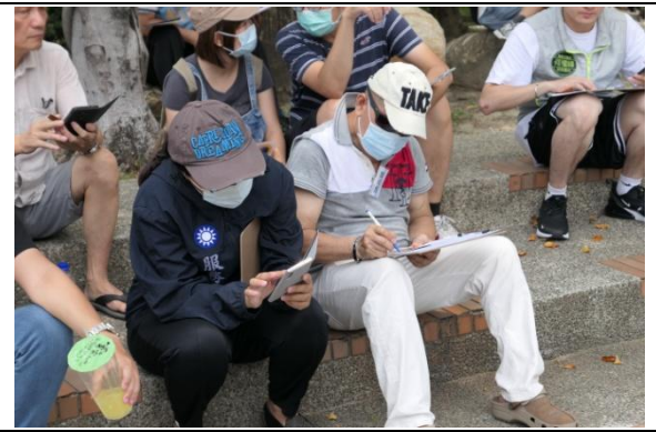
鼎泰里張里長認真記錄