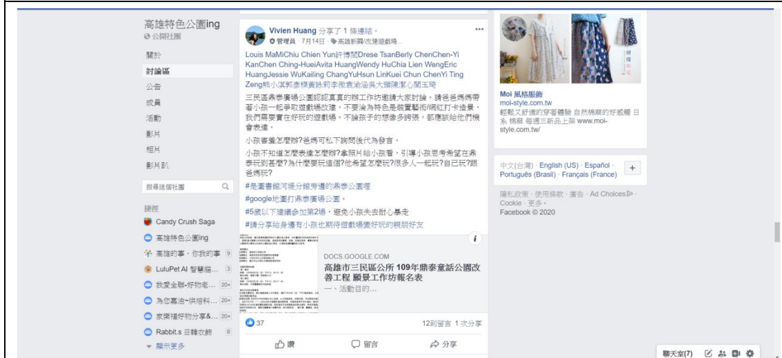
「高雄特色公園 ing」FB 公開社團活動分享