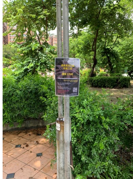
公園入口處張貼海報