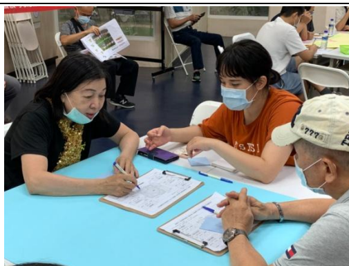
分組進行個人觀察心得與意見發表