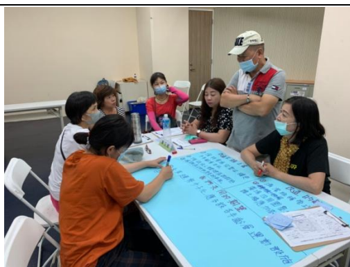
將各組意見進行收斂