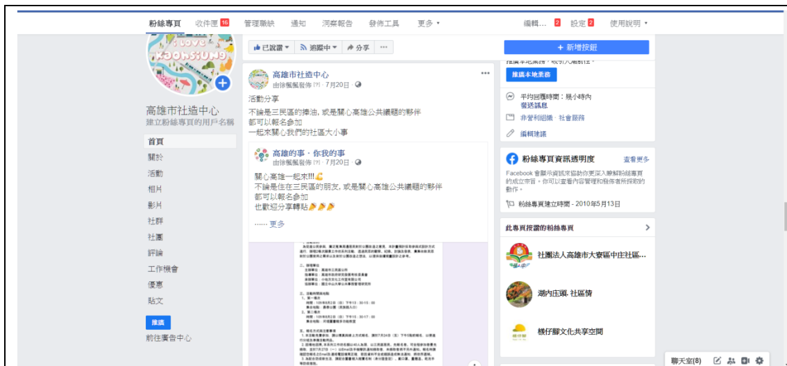
「高雄市社區營造中心」FB 粉絲頁活動分享