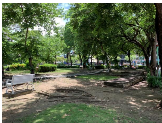
鼎泰廣場現場勘查