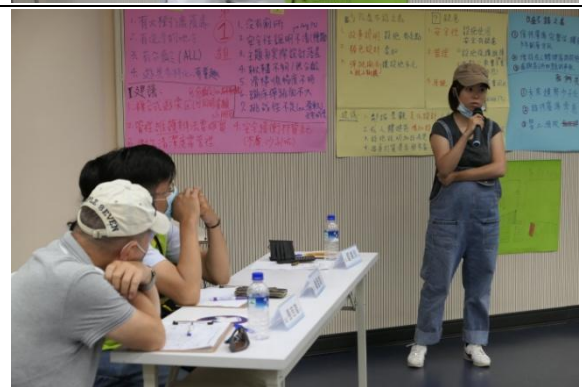
各組進行成果報告