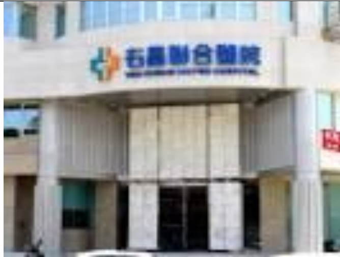
右昌聯合醫院附設護理之家