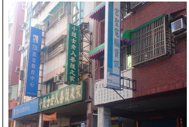
小護士老人養護之家