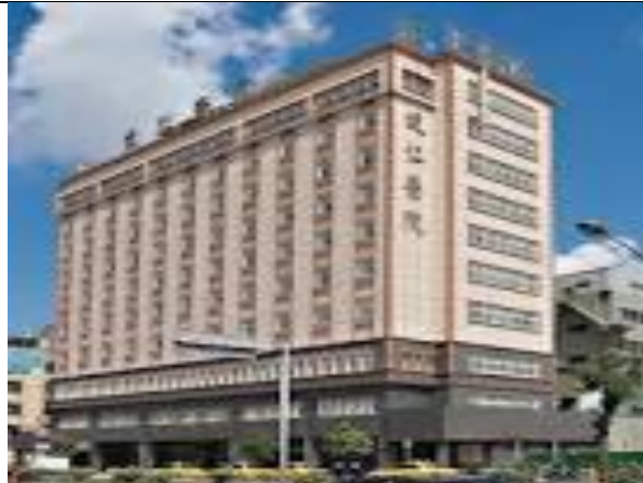
健仁醫院附設居家護理