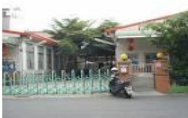
濟眾老人養護中心