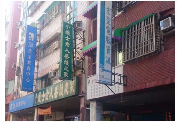
小護士老人養護之家