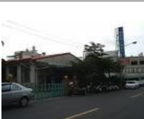
健安、新健安老人養護之家