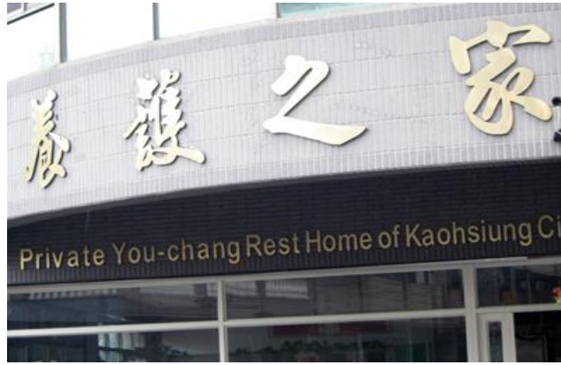
怡泉老人養護之家