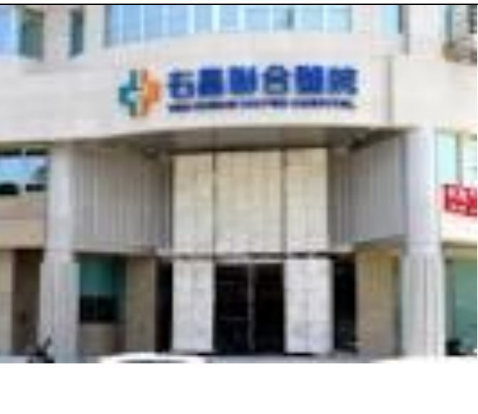
右昌聯合醫院附設護理之家