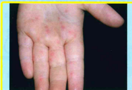
手足會出現小紅疹(水泡)