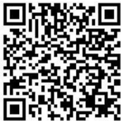
民眾版Line災情查通報