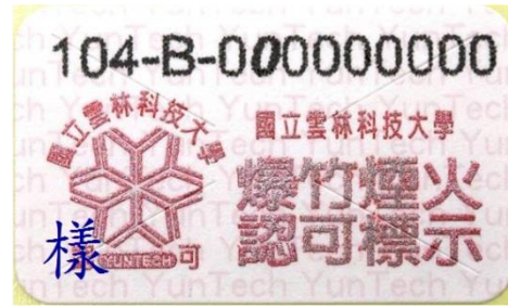
一般爆竹煙火認可標示

(三) 施放場所規定:下列地點不得施放爆竹煙火，違反者得處新臺幣 6 萬~30 萬元罰鍰。