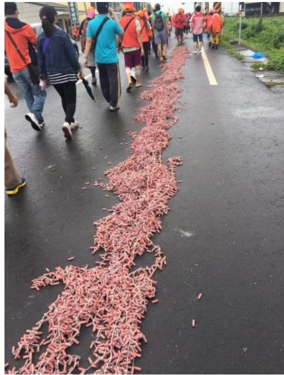
圖、串接或堆疊等錯誤燃放爆竹行為

3. 民眾購買一般爆竹煙火時，應選購貼有認可標示之合格產品，並確認產品上是否具有使用說明、廠商資料及主要成分等相關資訊，以確保安全，認可標示範例如下所示。持有未附加認可標示之爆竹煙火，達中央主管機關所定管制量 5 分之 1，處新臺幣 3 千~1 萬 5 千元罰鍰。