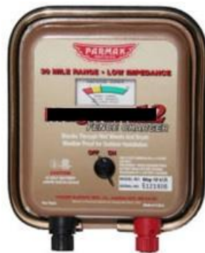
圖二：( 直流電 ) 電牧器(供電電源：DC12V 或 12 電池；最大能量傳輸距離 20 公里；輸出電壓：11KV；脈衝週期時脈衝電流：110mA 或 180mA；使用注意事項：(1)須安裝接地線(避免雷擊損毀)；(2)接電時應做好導線絕緣措施；(3)使用電壓檢測器量測電瓶電壓；(4)不可直接置於戶外任風吹雨淋；(5)農地較不適合使用太陽能型電牧器；(6)要經常巡查有無異物在電牧導線上避免漏電。)