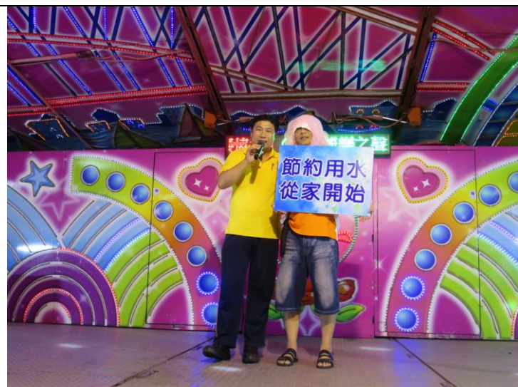
說明：工作人員協助宣導保護水資源