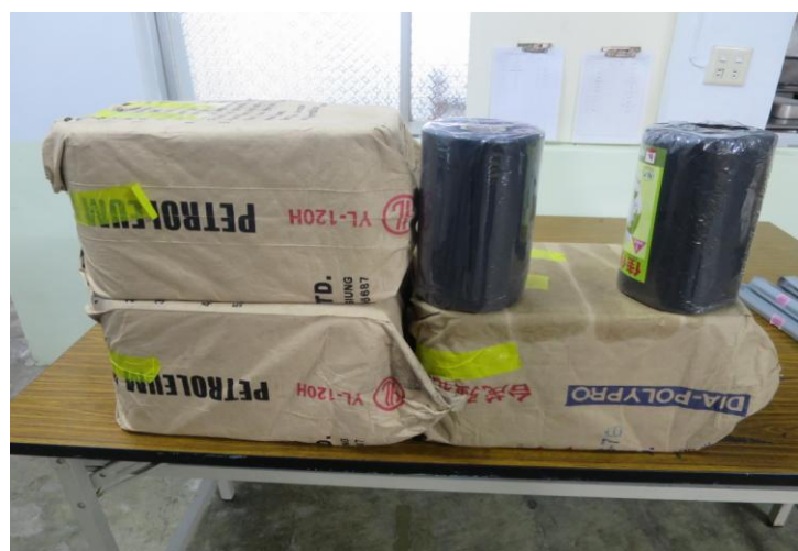
說明:垃圾袋 20 捲