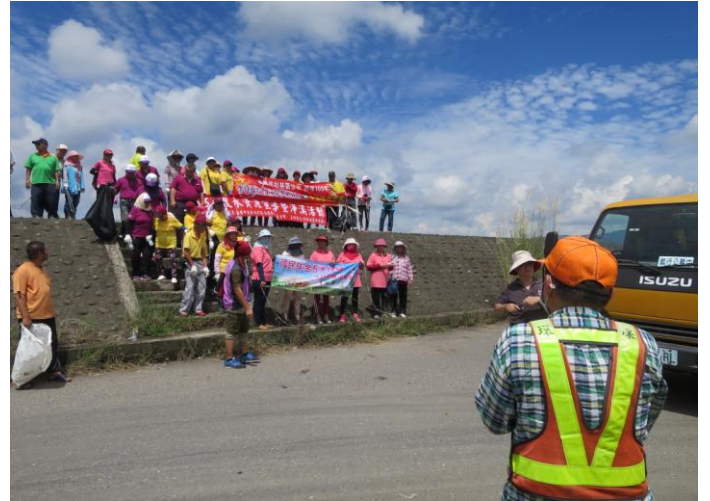
說明: 淨溪活動合照