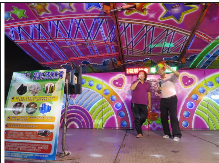
說明:工作人員協助宣導保護水資源