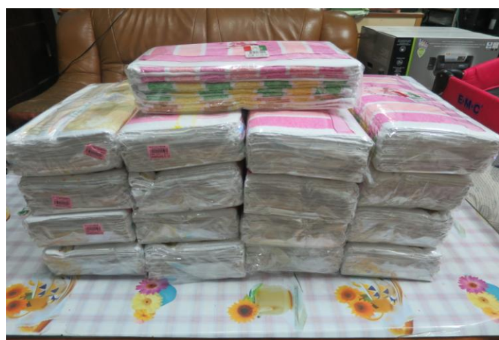
說明:毛巾 200 條