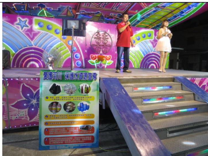
說明：工作人員協助宣導保護水資源