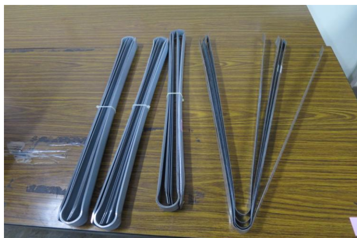
說明:夾子 50 支