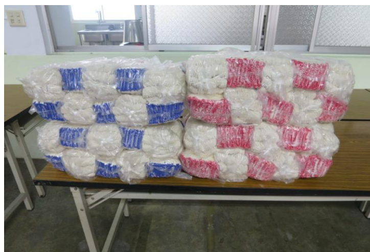
說明:手套 40 打