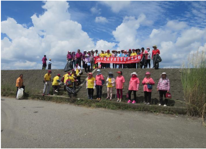
說明:淨溪活動合照